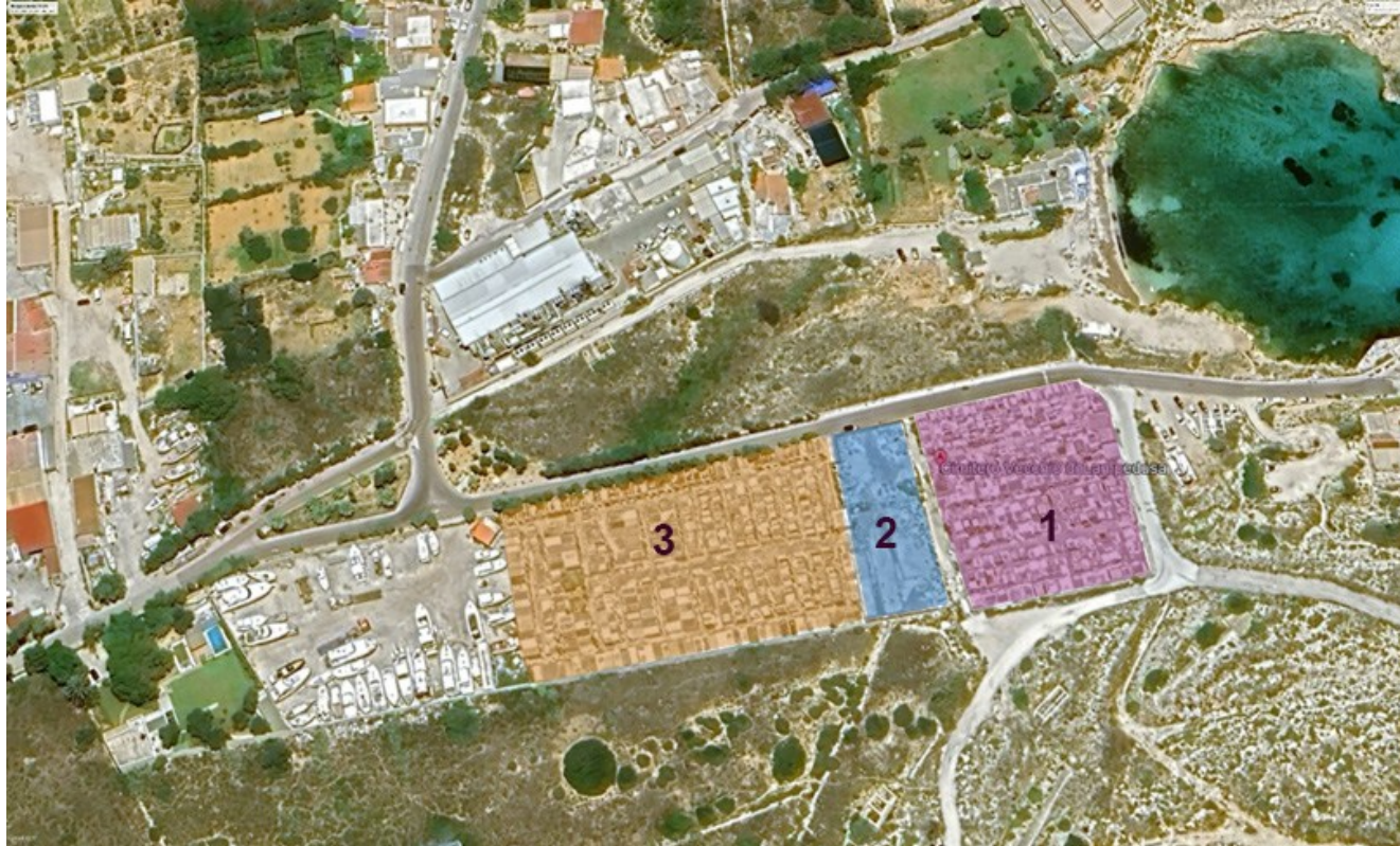
Cimitero di Cala Pisana: 1) cimitero vecchissimo, 2) cimitero nuovo, 3) cimitero vecchio

PROGETTI DI RICERCA DI ELEVANTE INTERESSE NAZIONALE